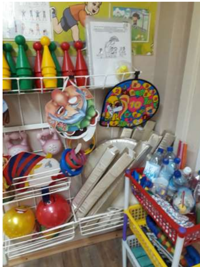
Группа общеразвивающей направленности для детей от 4 до 5 лет № 2