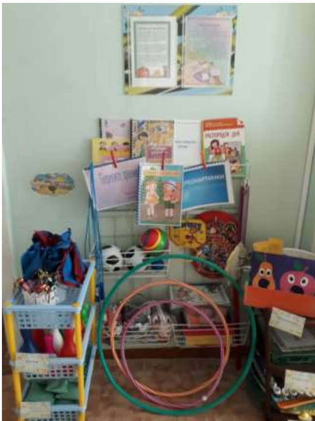
Группа общеразвивающей направленности для детей от 4 до 5 лет № 1