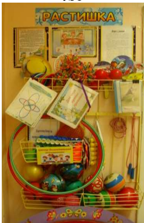
Группа общеразвивающей направленности для детей от 5 до 6 лет № 1